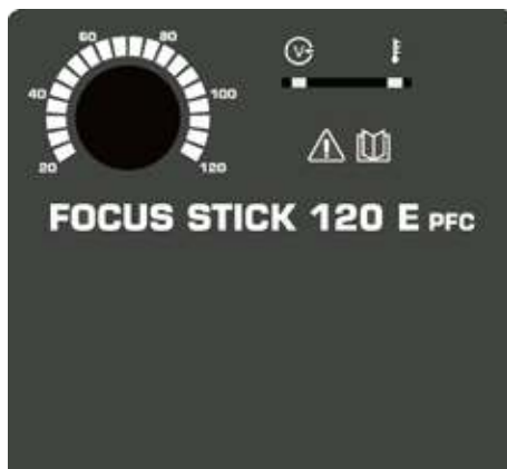
Контролен панел на Focus Stick 120 E